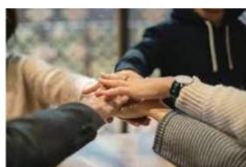
Op Adem, Aan Tafel